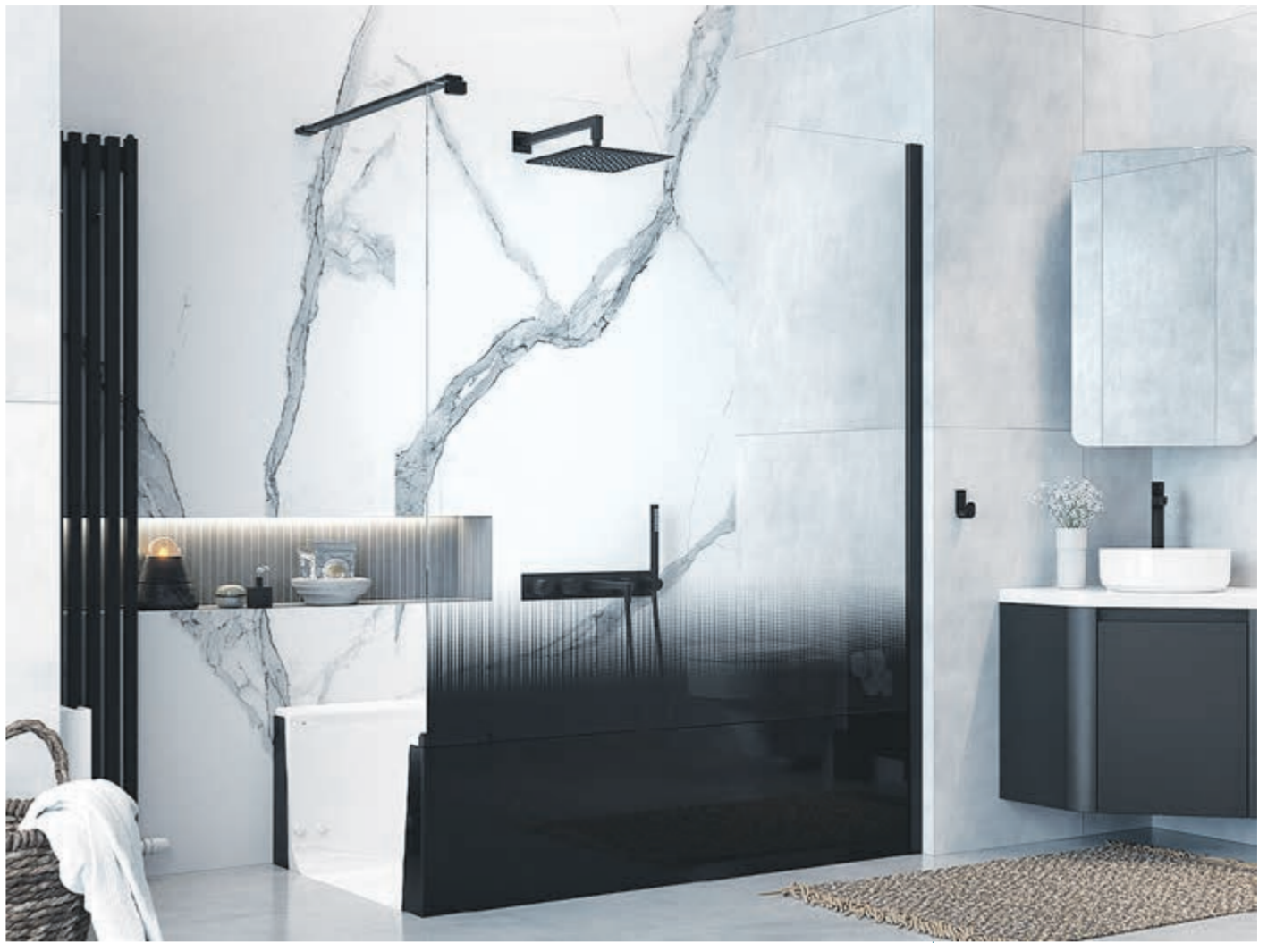
Auf den ersten Blick eine schicke, barrierefreie Walk-in-Dusche, die durch ein einfaches Schott zur komfortablen Badewanne wird: Mit der „JOICE Walk In+“ präsentiert Artweger bei der Verbrauchermesse eine Weltneuheit.