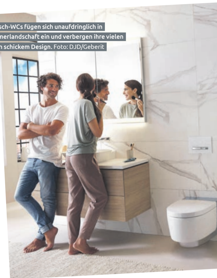
Moderne Dusch-WCs fügen sich unauffällig in die Badezimmerlandschaft ein und verbergen ihre vielen Funktionen in schickem Design.

Mit ausgefeilten Technologien erzeugen sie einen sanften und gründlichen Duschstrahl. Extrafunktionen wie die Trocknung des Pos mit einem eingebauten Föhn, eine Geruchsabsaugung, eine Sitzheizung oder ein WC-Deckel, der sich automatisch öffnet und schließt, bringen Verwöhmungsmomente im Alltag. Großes Pluspunkt vieler aktueller Modelle: Ihre Optik nähert sich immer mehr einer ganz normalen WC-Keramik an, deren Funktion nicht auf den ersten Blick erkennbar ist. So fügen sie sich dezent in die Badezimmerumgebung ein. Davon kann man sich bei der SHK-E-Verbrauchermesse gleich an mehreren Ständen führender Hersteller überzeugen. (djd)