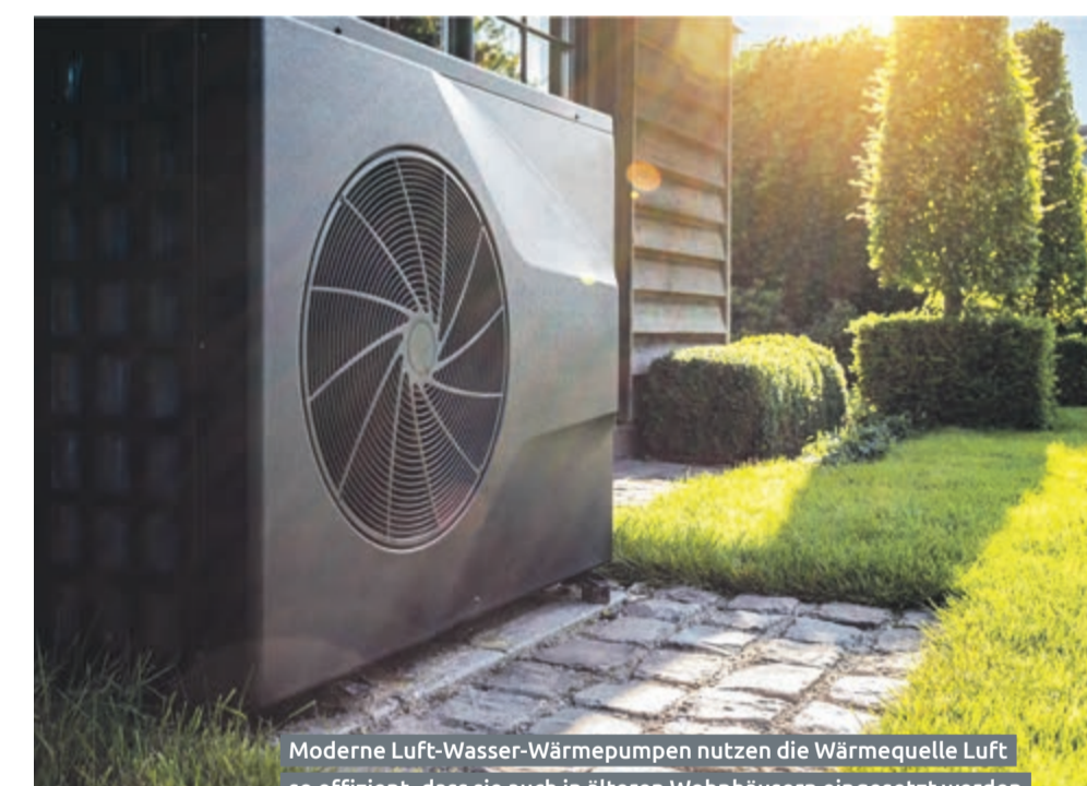
Moderne Luft-Wasser-Wärmepumpen nutzen die Wärmequelle Luft so effizient, dass sie auch in älteren Wohnhäusern eingesetzt werden können.