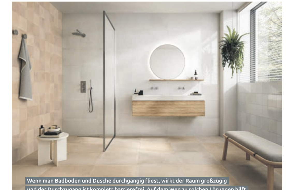
Wenn man Badboden und Dusche durchgängig fliest, wirkt der Raum großzügig und der Duschzugang ist komplett barrierefrei. Auf dem Weg zu solchen Lösungen hilft der Staat.